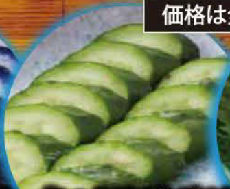
きゅうり1本漬け 280円